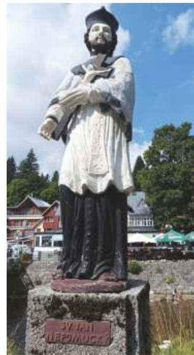
Jan Nepomucký, patron kněží, zpovědníků, lodníků, vorařů, mlynářů, vyzván za mlčenlivost, proti nebezpečí vody a na ochranu mostů, symbolicky chrání nejenom lokalitu centra Špindlerova Mlýna.

organický zbytek, který byl považován za zázračně uchovaný jazyk. Kult se rychle rozšířil do celého katolického světa. Dnes najdeme kostely, kaple a sochy zasvěcené Janu Nepomuckému na všech kontinentech a také ve Špindlerově Mlýně. -dp-