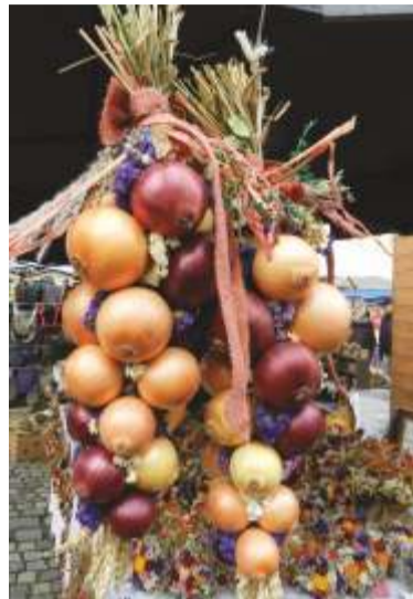
Svazek cibule z krkonošské tržnice.

byly však jednou z nejrozšířenějších zemědělských plodin. S třešněmi a jabloněmi bylo možné se setkat ještě kolem 900 m n. m., s hrušněmi kolem 800 m n. m. Nedostatek ovoce nahrazovali budaři sběrem lesních plodů - borůvek, brusinek a malin. Byly významným zdrojem vitaminů. Urodí-li se v létě hodně borůvek, bude málo pohřbů, znělo zdejší přísloví.