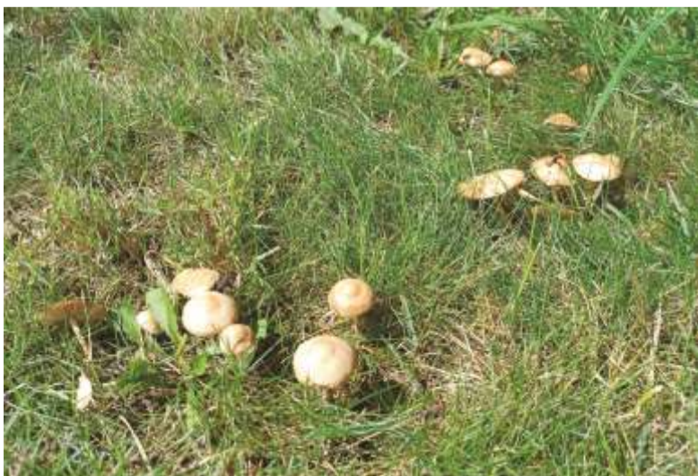
Ilustrační foto: houbičkám no name se daří také např. na loučce u Labe v centru města před hotelem Savoy.