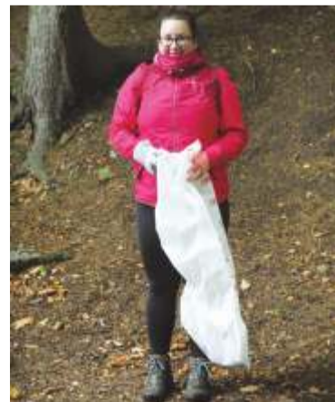
Ilustrační foto úklidu v terénu.