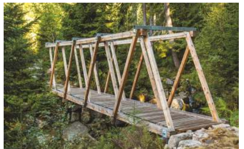
Lávka přes Medvědí potok zavede k Medvědí Boudám nedaleko Šp. Mlýna.