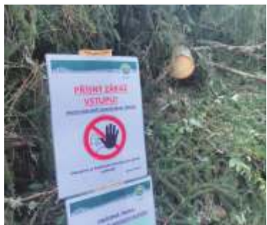
Krkonošský národní park se i s ochranným pásmem rozkládá na 55 000 hektarech. Rozloha dnešních lesů na české straně Krkonoš je zhruba 37 000 hektarů. Dbejte pokynů a neriskujte.

V polovině července, resp. v noci ze středy 14. na čtvrtek 15. července 2021, po jediné bouři, která se přehnala přes Trutnovsko, padlo v Krkonošském národním parku během pár minut k zemi 20 tisíc krychlových metrů dřeva. Ročně je v KR-NAP naplánovaná těžba přibližně sta tisíc kubíků, bouře tak poslala k zemi 20 % ročního plánu.