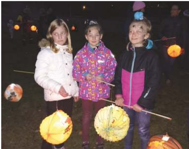
Fotografie ze špindlerovské oslavy Halloween.