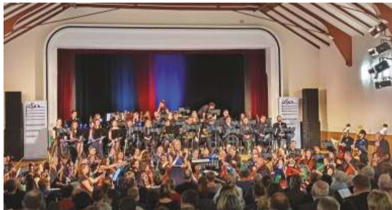
Ilustrační snímek z průběhu mimořádného koncertu.