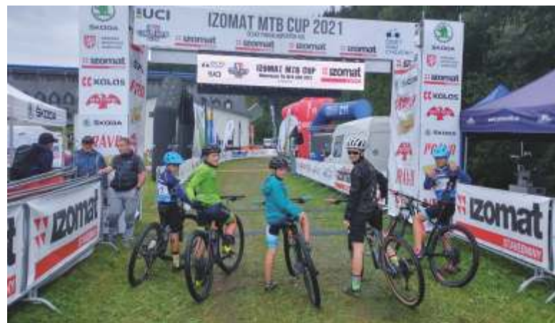
Foto z účasti závodníků Bike Team Špindlerův Mlýn v Českém poháru horských kol.