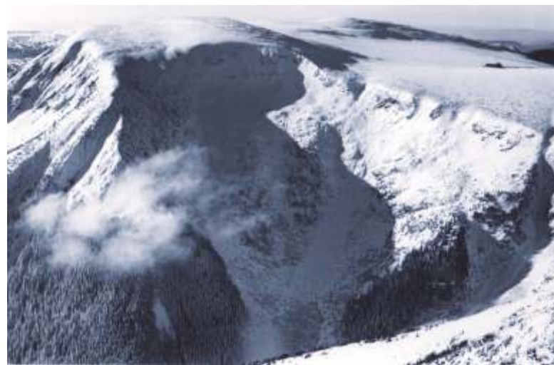
Studniční hora, hrana Obřího dolu a Luční bouda.

V letech 1967/8 až 1970, vždy v zimních měsících, byly Krnapem v oblasti jižních svahů Studniční hory denně monitorovány klimatické podmínky a zkoumány výskyt botanických fenoménů. Parametry počasí, množství sněhu, větru, mlhy. Po celou dobu to byl pro pracovníky Parku velký stres, protože šlo o lavinové území.