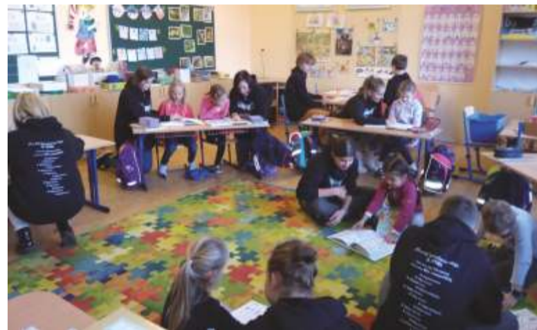
Předávání slabikářů od jejich patronů z 9. třídy.