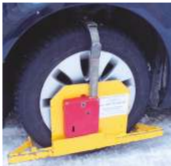
Ilustrační foto -dp-

Vážení řidiči, žádáme vás, abyste nezapomínali svá vozidla označit platnou povolenkou v bílé barvě pro aktuální rok 2022 (červená platí jen pro období od 1. 5. do 31. 10.). Prosíme, nekopírujte je, ať je to z jakéhokoliv