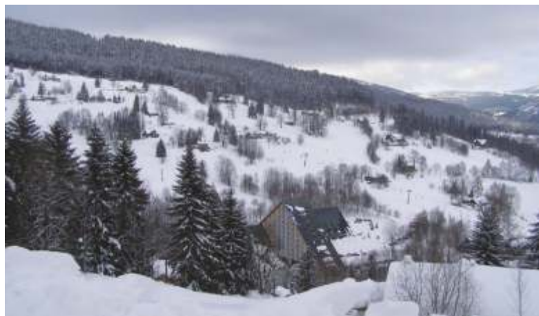
Ilustrační snímek Labské, rodina Novotných.

Situace je však tristní. Hosté, v zimě ubytovaní na Labské, jsou především rodiny s dětmi, školní kurzy, senioři apod., kteří mají o pobyt v této lokalitě zájem právě proto, že sjezdovka i lanovka jsou v optimálním dosahu jejich ubytování. Kopec na Labské má specificky členitý svah, lanovku fungující i v silných povětrnostních podmínkách, a je vhodný pro klientelu, která nevyhledává ruch velkých sjezdovek, nebo pro běžkaře mířící na tratě Horních Míseček. Majitelé objektů na Labské zdůrazňují, že lokalita má velkou kapacitu uby-