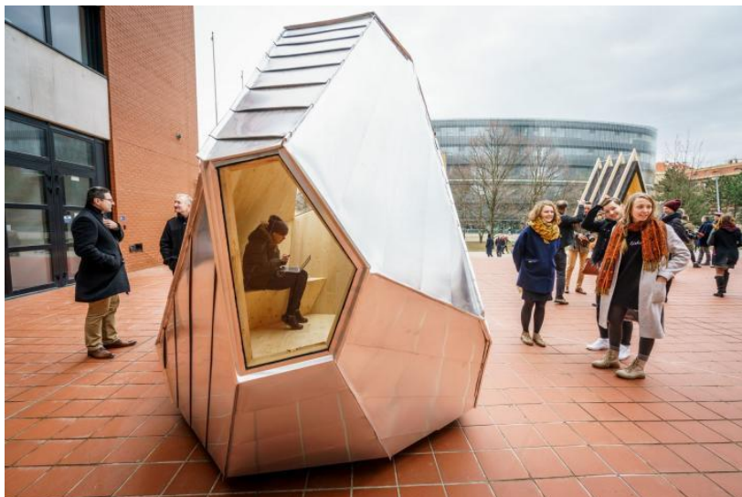
Nové útulny v Krkonoších

Zaměstnanci Škoda Auto opět pomáhali uklízet přírodu v Krkonoších. 101