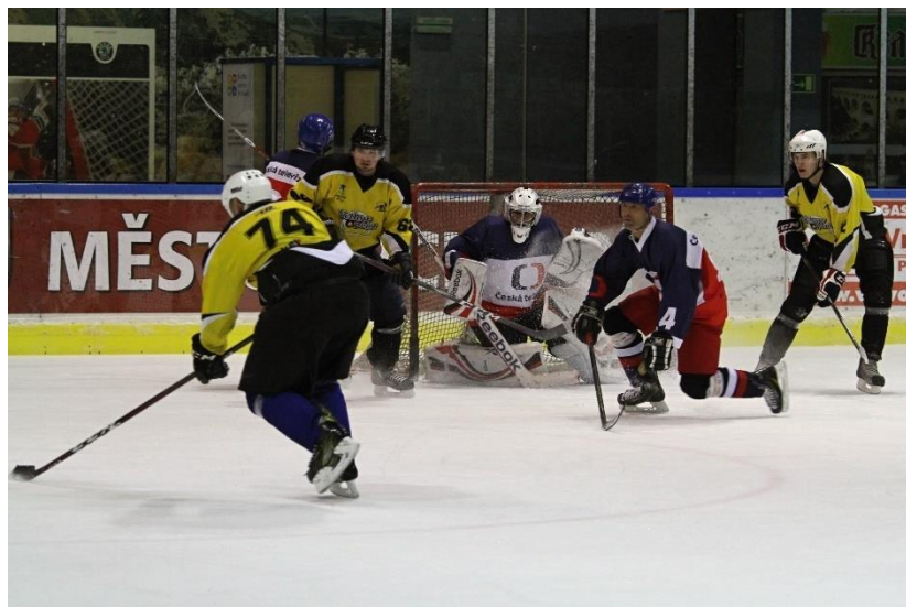
Hokejový zápas České televize a Yellow Pointu

9. března se žáci deváté třídy základní školy symbolicky loučili se svým působištěm na každoročním Šerpování na Vojenské zotavovně Bedřichov. 80