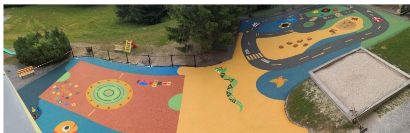
Nové hřiště ve školce

Záchranáři s policií hledali v okolí města houbařku, která dlouho nereagovala na telefonní výzvy. Složky ji za pomoci psůvodů našli zcela vysílenou ležet a museli ji pomoci do nemocnice. 150