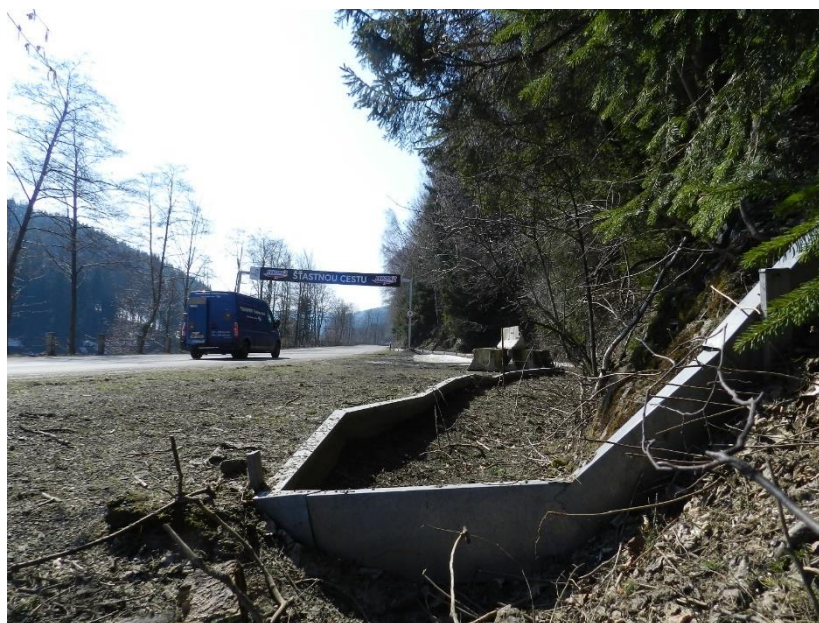
Zábrany na žaby proti jejich přejetí

V okruhu hotelu Clarion došlo k běhu za osvětu o mozkové mrtvici, kterého se účastnilo na 73 běžců, ať už běžných lidí nebo lékařů. Na akci se podařilo na osvětu proti této nemoci vybrat na 35 900 korun. 117