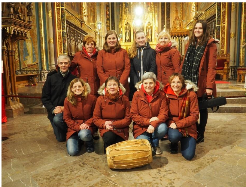
Koncert kapely Petach na Vyšehradě