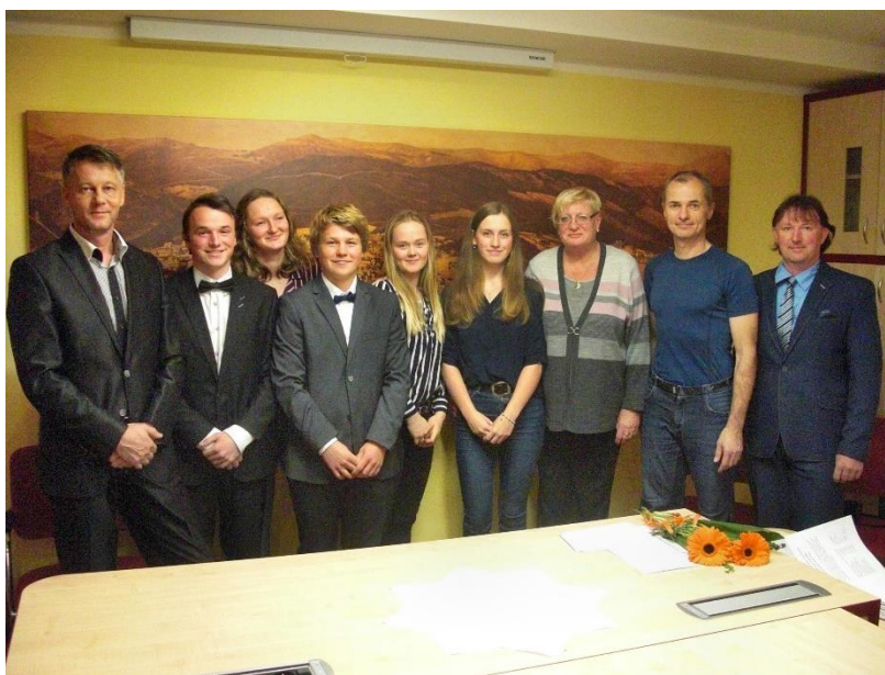
Vítání nových dospělých