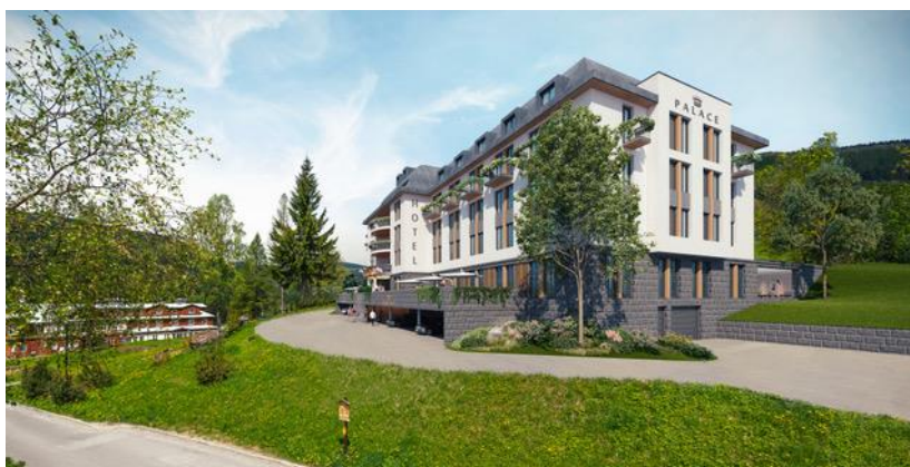
Nová podoba hotelu Palace

Dobrovolníci šli znovu vyčistit Krkonoše po letní sezóně a podařilo se jim sesbírat 2,5 tun odpadu. 176