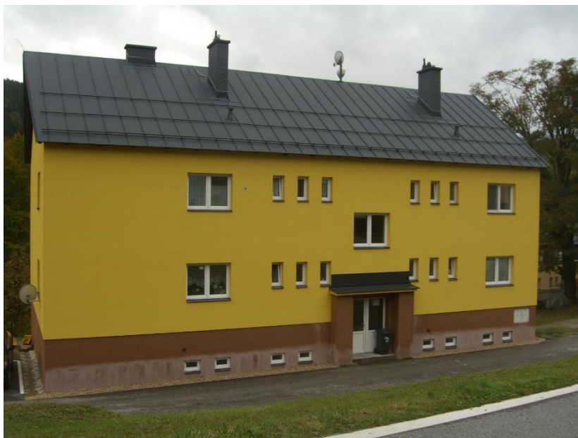
Nová podoba bytového domu na Bedřichově