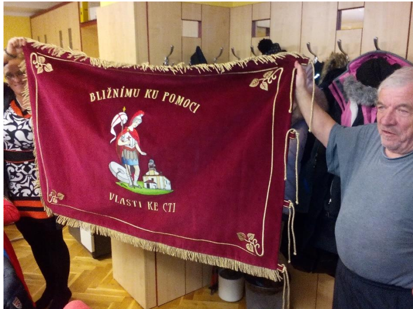
Nová prapor hasičského sboru u příležitosti výročí

Skauti pomáhali v Krkonoších s odklidem nebezpečného dřeva. Povedlo se jim odstranit na 200 m 3 stromů. 162