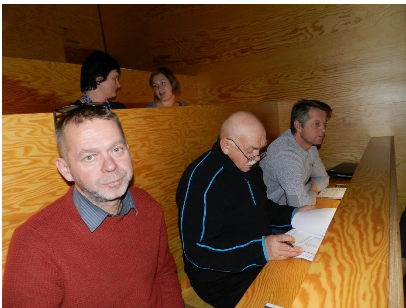
Valná hromada Krkonoše Svazek měst a obcí