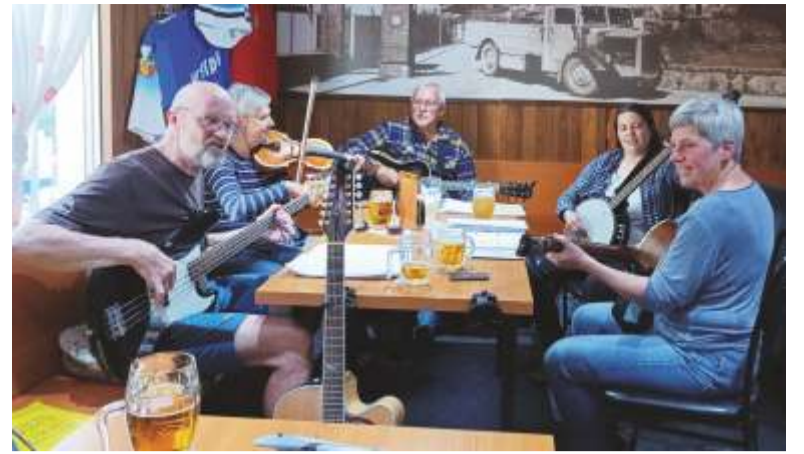
Hudební sešlost