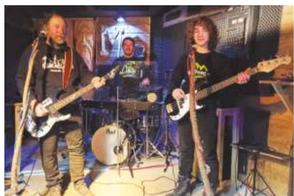
Kapely Bandor a SackSuppe.

Kontakt a pozvání na koncerty Bandor najdete na Facebooku.