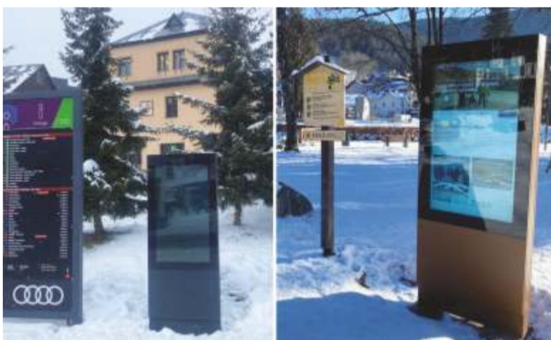
Ilustrační snímky LCD panelů

Druhý zcela nový panel naleznete v městském parku v blízkosti dřevěné sochy Špindlerovského mlynáře. Jeho obsah informuje turisty o dění ve městě, slouží k propagaci kulturních pořadů a sportovních akcí. Zhlédnout v něm je možné rozmanitá propagační videa a další zajímavosti.