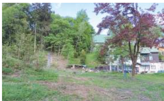
Část zájmového území.