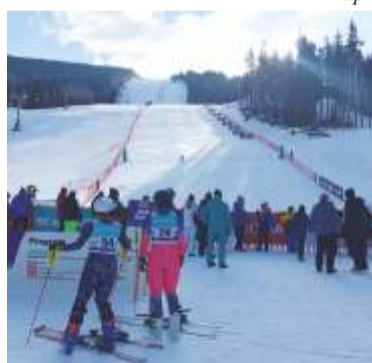
Skiareál ve Svatém Petru - Kästle EP žen ve slalomu 2025.