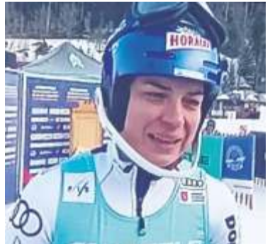
Česká slalomářská jednička Martina Dubovská.