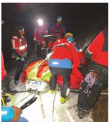
Ilustrační snímek z nočního zásahu záchranářů.

Připomínka Dne Horské služby 24. března - příběh B. Hanče, V. Vrbaty, E. Ratha a dalších účastníků tragické události z roku 1913 ožívá každoročně v myslích jilemnických lyžařů, členů Horské služby, přátel a milovníků hor. Připomínají si ho tradičně pietní akcí u Mohyly Hanče a Vrbaty na Zlatém návrší. Zároveň je tento den vždy poněkud slavnostnější pro horské záchranáře. Ti jej slaví, jako Den Horské služby . Pokud znáte příběh „Synů hor“ a dosadíte si práci horskoslužebníků, potom je naprosto zřejmé, proč byl 24. březen vybrán jako „Den Horské služ-