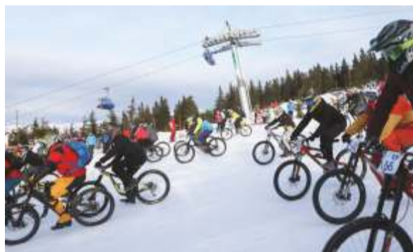
Závod v jízdě na kole „Chinese Downhill“.

ski party na terase Champagne Lounge v „srdci“ Svatého Petra u depa šesti-sedačkové lanovky Innogy line. Po celý den bylo slyšet hudební sety známých i místních DJs.