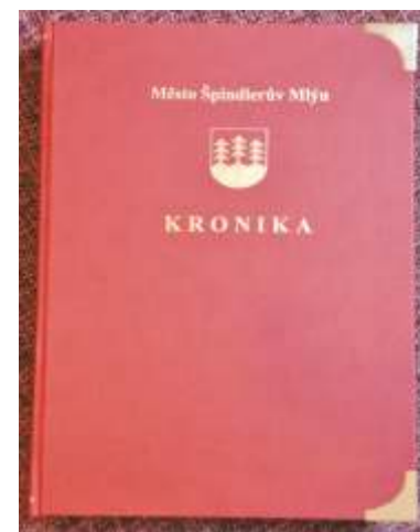
Kronika Špindlerova Mlýna.

Co se týče samotného konkrétního obsahu, nedá se asi přesně specifikovat, jaké zprávy do kroniky vybírám. Mnohdy jde o zprávy, které jednoduše popisují typický styl života ve městě s konkrétními případy, které to podkreslují. Zároveň tam patří i události, ať jsou jakéhokoliv druhu nebo žánru, se kterými se skoro snažím přiblížit ke klasické konstruktivní a objektivní žur-