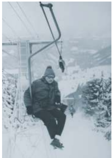
„Opice na háku“, tak byli mezi fotografy v soukromí nazýváni rekreační fotičci na jednosedačkové lanovce na Pláň.