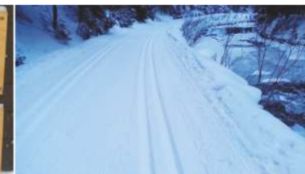
Jistě si i vy pamatujete na dřevěný srub Správy KRNAP u začátku stopy se suvenýry, pohlednicemi a ochotnou obsluhou. Na otázku: Proč byl odstraněn, zdali Správa KRNAP plánuje ve stejných místech srub nový, a také obnovu dřevěných informačních tabulí (viz. fotografie), které se vázaly k časovým výsledkům dosaženým při běhu na lyžích ve stopě?, Radek Drahný, tiskový mluvčí, vedoucí oddělení styku s veřejností Správy KRNAP, odpověděl: „Přivodní dřevěný srubek dožil. Plánujeme tam nějakou mobilní stavbu, nyní je stav, že čekáme od ČEZu zhotovení přípojky do daného prostoru, protože tam není elektrina. Co se týká gravírovaných cedulí, které tam už také nejsou, neplánujeme jejich návrat. Tematicky nesouvisí s naší činností“, vysvětlil R. Drahný. Upravovateli stopy „Bud' fit“ patří poděkování.