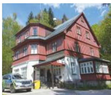
Zázemí sídla obvodního oddělení Policie ČR ve Šp. Mlýně je dobře vybaveno, nechybí celá předběžná zadrženi.

„S tím souhlasím, není vinou městské ani státní policie, že není ideální. Jedná se o dlouhodobý problém. Za uplynulých téměř 30 let, co mohu sám posoudit, se ve Špindlu z hlediska dopravy, systému parkování, parkovacích kapacit, dopravního značení a kamerových systémů mohlo vymyslet a udělat daleko více. Bohužel musím konstatovat, že parkovací kapacita je v tomto období nedostačující a Policie ČR a městská policie, řeší už jen následek. Bez rozšíření a navýšení parkovacích kapacit, bude dopravní situace v těchto dnech i nadále složitá. Situace by se