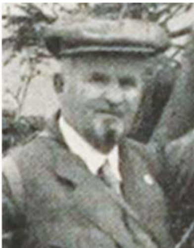
Jindřich Leopold Ambrož.