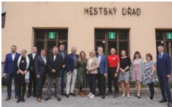
Ilustrační snímky z návštěvy prezidentského páru.