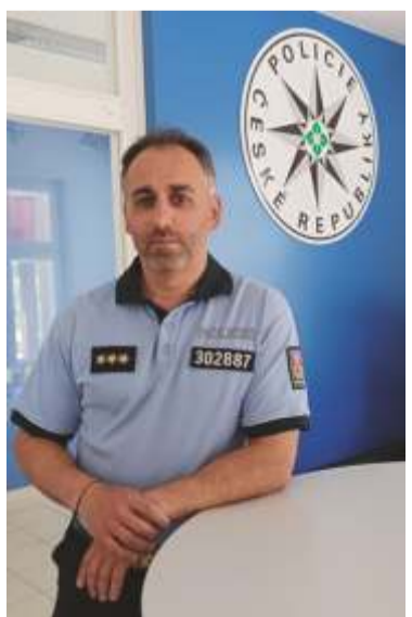
Komisař npor. Petr Přívratský, velitel obvodního oddělení Policie ČR.