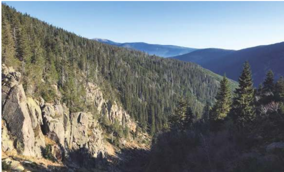
Pohled do Labského dolu v Krkonoších.