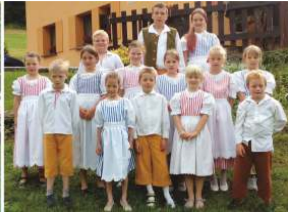
Rok 2017 - tábor Penzion Popelka.