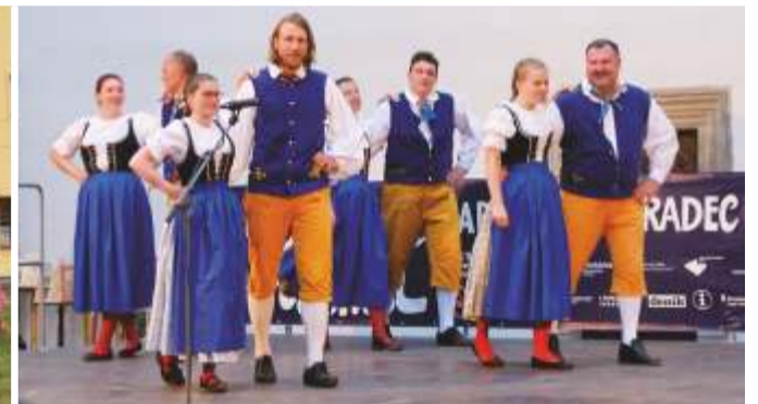
Rok 2021 - Folklorní festival Pardubice.