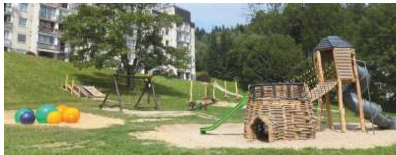
Ilustrační snímek nového volnočasového vybavení.

Nová lanová dráha, sestava igloo s tobogánem, skluzavka pro nejmenší a „jelly bubbles“ (hravé míče) začátkem letošních letních prázdnin obohatily dětské hřiště na sídlišti Bedřichov. Díky městu a Nadaci ČEZ - Oranžové hřiště 2022 - byly zastaralé a poškozené prvky vyměněny za nové. Příjemný prostor pod bytovkami, nad areálem mateřské školy, vyhrazený ke hrám a odpočinku dobře slouží. Je často navštěvován a využíván nejenom místními dětmi.