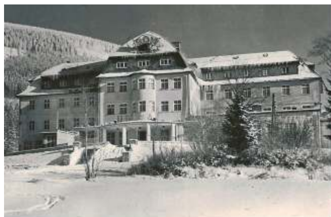
Někdejší hotel Palace, resp. zotavovna ROH Dukla, anebo filmová zotavovna ROH Radost.

Odtud pokračujte k rozcestí vpravo prudším stoupáním. Po levé ruce míjíte jednu z budov základní školy, vpravo kapličku a nad ní druhou budovu ZŠ. Když vystoupíte k cestě, vlevo pod lesem neminete kulatou dřevěnou zastřešenou stavbu - Biskupskou vyhlídku. Je příjemným odpočinkovým místem s výhledem na vrcholky hor, jimiž je Špindlerův Mlýn obklopen. Směrem dolů po silnici procházíte kolem hotelu Palace (dříve zotavovna ROH Dukla), jehož původní interiéry i exteriéry byly použity v českém filmu „Homolka a tobolka“. V současné době je objekt nově postaven.