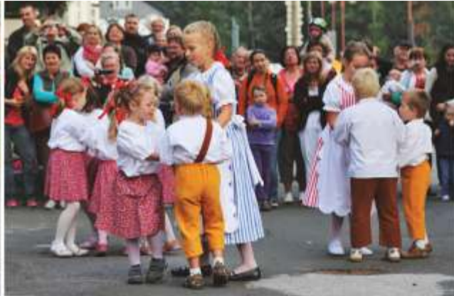
Rok 2014 - 35. výročí muziky.