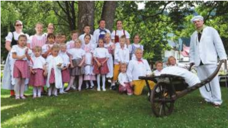
Rok 2016 - Mlynářovy toulky Šp. Mlýn.