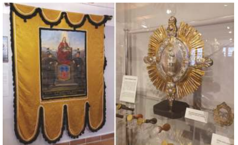
Snímky z výstavní expozice