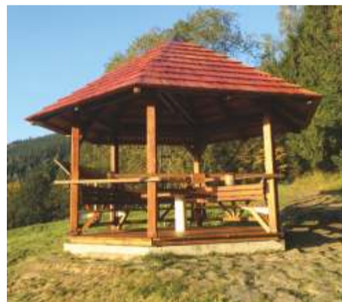
Altánek Biskupova vyhlídka je pěkným cílem pěší procházky, odkud je nádherný rozhled po okolní krajině a směrem na lyžařský areál na Medvědině.