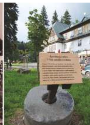
Upoutávka na vznik městečka, které si v nadcházejícím roce 2023 připomeneme mimořádné výročí.