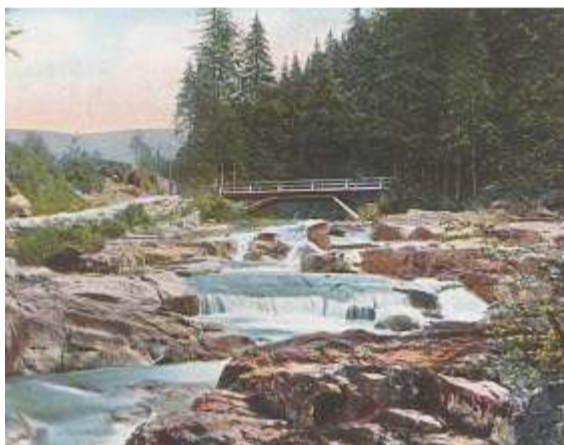
Snímek mostu Dívčí lávky z roku 1916 (Jubiläumsbrücke) v archivu Krkonošského muzea Správy KRNAP.