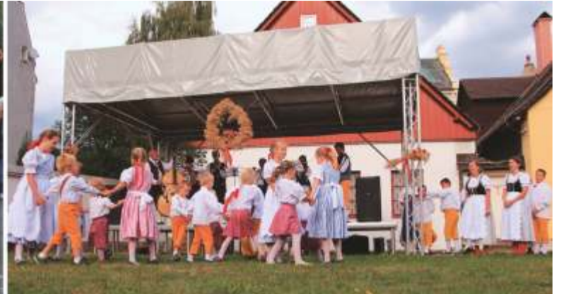
Rok 2015 - Dožínky Vrchlabí.