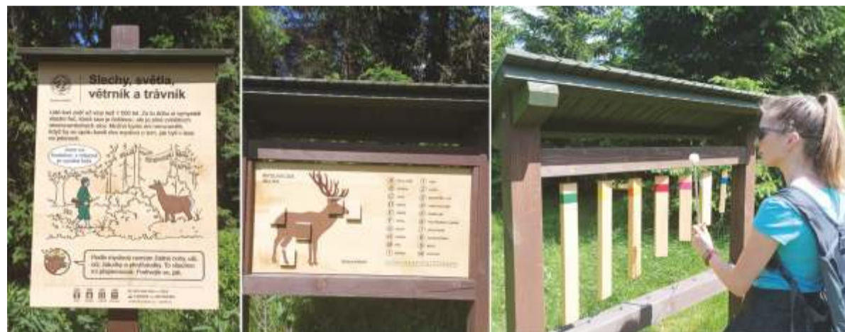
Ukázka několika panelů Jelení naučné stezky.