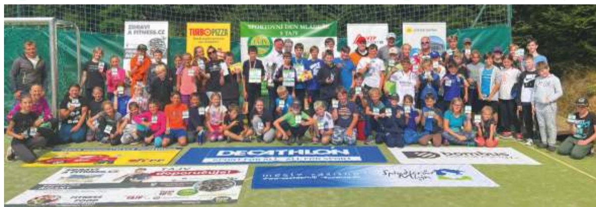
Ilustrační snímek