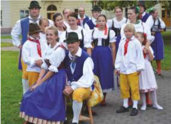
Rok 2013 - 50. Europeada - Gotha (Německo).