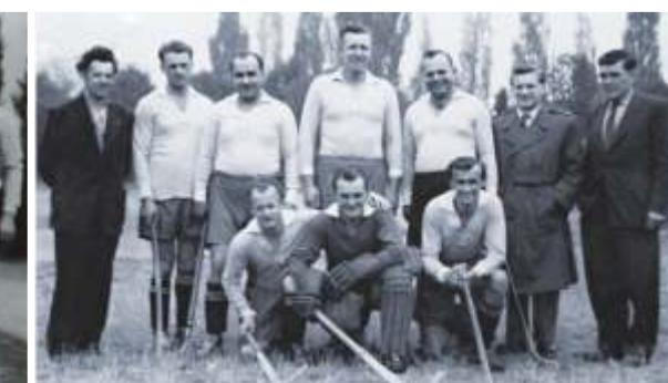
Archivní snímky z tréninků dětí, zápasů žen i mužů.