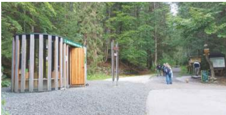
Exteriér a interiér nového sezonního informačního střediska Správy KRNAP.