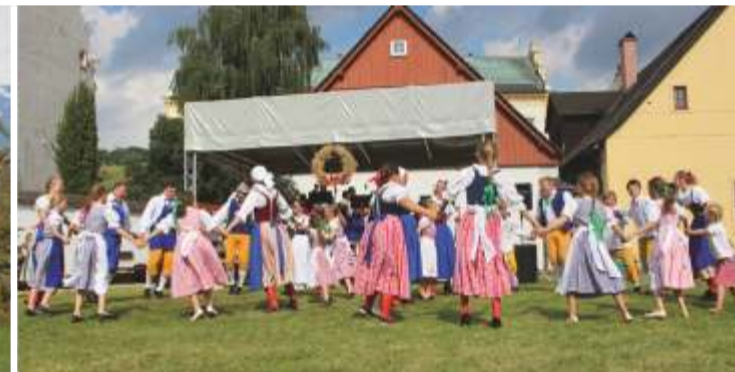
Rok 2020 - Dožínky Vrchlabí.