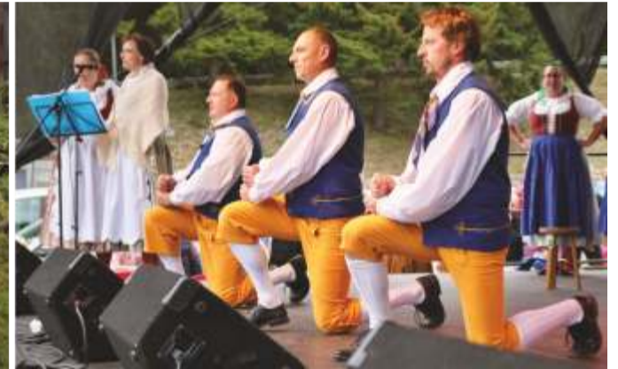
Rok 2018 - pouť Špindlerův Mlýn.