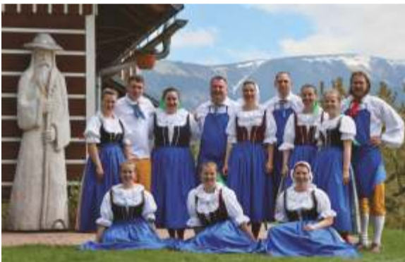
Rok 2019 - natáčení pro Českou televizi.