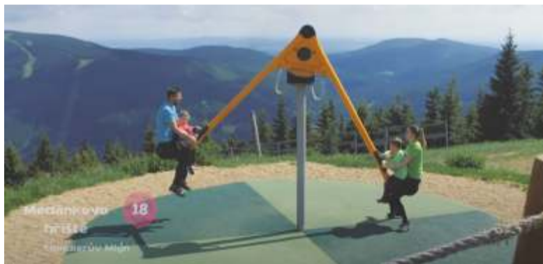
Záběr z motivačního videa.

https://www.youtube.com/watch?v=89u-29v2pZA&t=3s .