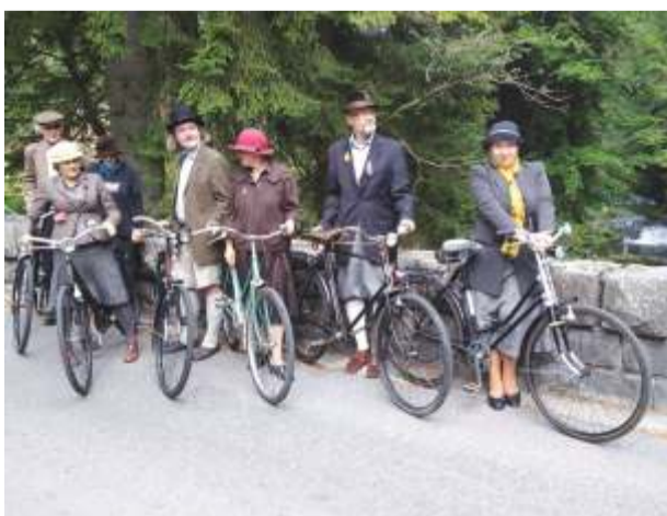
Významné výročí architektonické dominanty na Dívčích lávkách připomněl Spolek špindlerovských lyžníků.

Z podkladů Pavla Kociána ze Správy KRNAP upravila -dp-