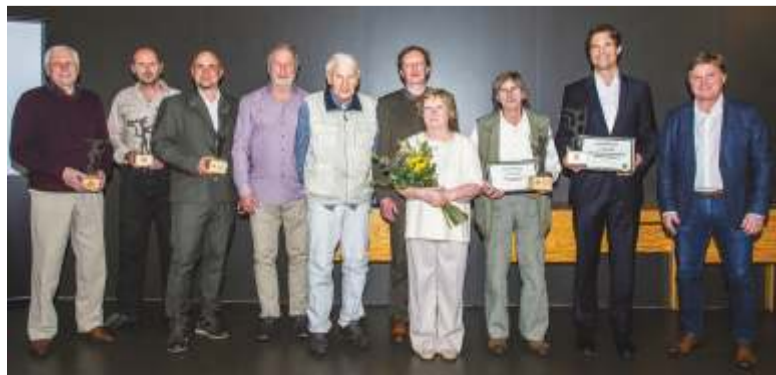
Ilustrační snímek ze dne předání, Správa KRNP. Videoportréty oceněných na https://youtu.be/OnFwK0jyFoI