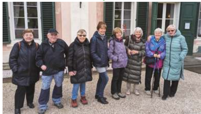
Ilustrační snímek z výletu do Ratibořic.