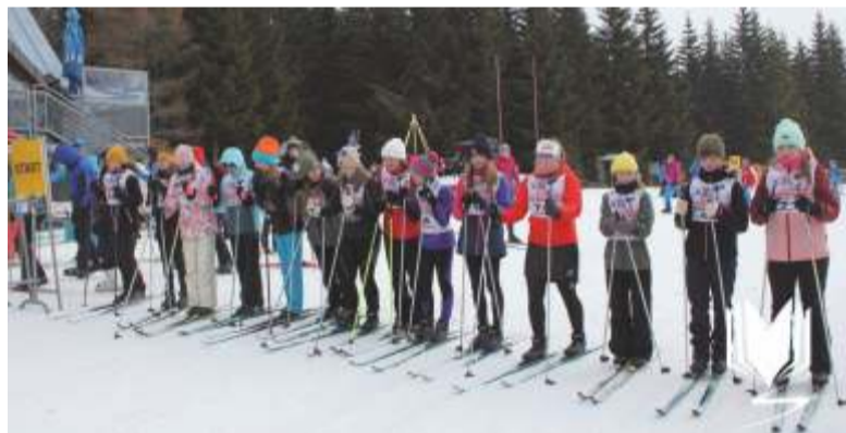
Ilustrační fotografie z běžeckých závodů na Horních Mísečkách, archiv: ZŠ Šp. Mlýn. Další snímky na www.zsspindl.cz

Pro žáky byl 7. března 2024 připraven tradiční obratnostní závod na běžkách v blízkosti stadionu Mísečky. Závodníci si museli poradit s mnoha překážkami např. slalom, jízda pozadu. Délka závodních okruhů byla přirozeně odstupňována dle věku, celkově se na start postavilo přes 100 žáků. Největší obdiv patřil všem prvňáčkům, kteří si bravurně poradili s nelehkou tratí. Zimní atmosféru školních závodů umocnilo větrné a chladné počasí.