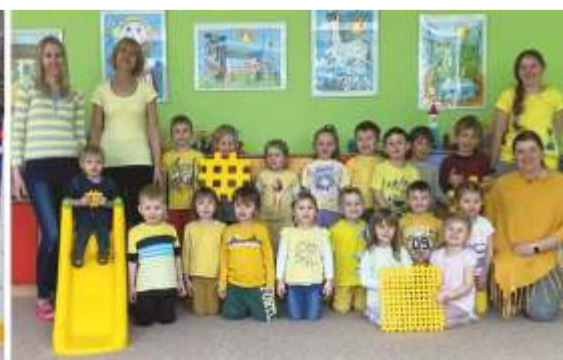
Ilustrační foto z aktivit: Karneval, bruslení, Barevný týden.