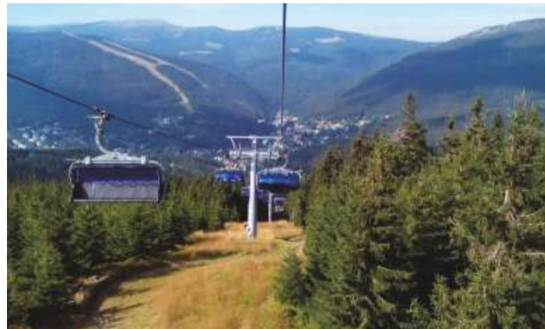
Šestimístná lanovka s „bublinou“ na Pláň.