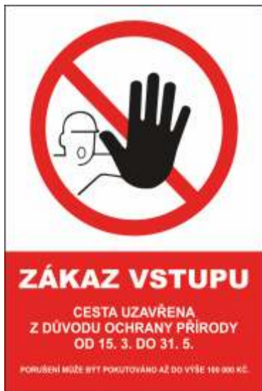
Cedule upozorňující na uzavření cesty nebo úseku, z důvodu ochrany proti rušení citlivých druhů živočichů.