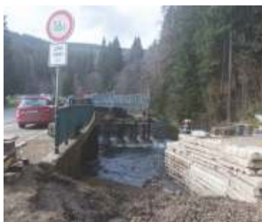
Dubnové započetí revitalizace mostu u Michlova Mlýna.

Jedná se o realizaci rekonstrukce jednotlivých mostů na silnici II/295, v extravilánovém úseku mezi obcemi Vrchlabí a Špindlerův Mlýn, v k. ú. Labská a Přední Labská. Rekonstrukce jed-