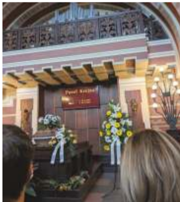
Ze smuteční síně.