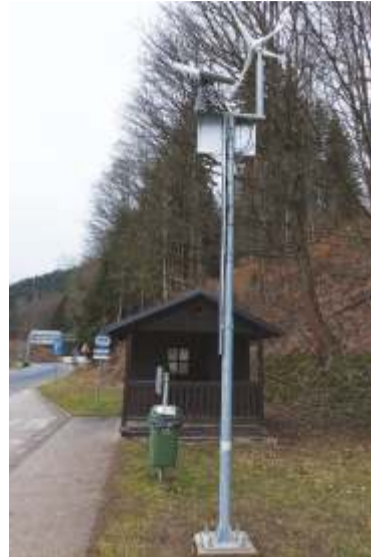
Prototyp vhodných lamp u autobusové zastávky Terminál P1 je stále ve zkušebním provozu.

Terminál P1, resp. u nevyznačeného přechodu přes silnici. LED lampa, která je v ČR prototypem pro náročné horské klimatické podmínky, dorazila od výrobce bohužel rozbitá. Druhá lampa nevydržela zkušební provoz. Nová technologie, resp. úprava off-line systému, ve kterém je zapojena, je zatím stále testována. Od záměru moderního osvětlení této lokality neustoupíme. Věřím, že se brzy podaří vybrat vhodný prototyp.