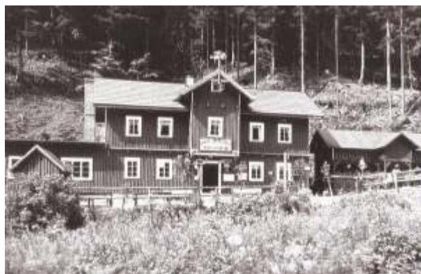
Bouda U Dívčích lávek.

Historický snímek, archiv Špindlerovské noviny.