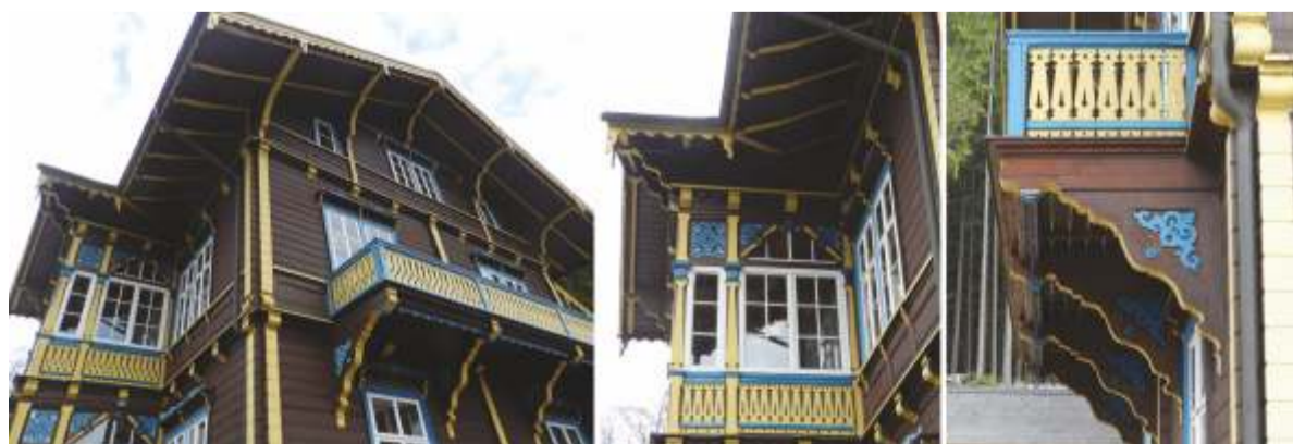
Původní šlechtické sídlo Villa Czernin nebylo památkově chráněné. Fotografie jsou pořízeny těsně před rozebráním objektu.

Z podkladů Pavla Klimeše, Veselý Výlet, zprac. -dp-