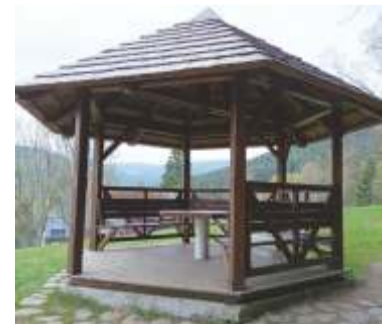
Jediné, co zůstalo, je altánek Biskupova vyhlídka.