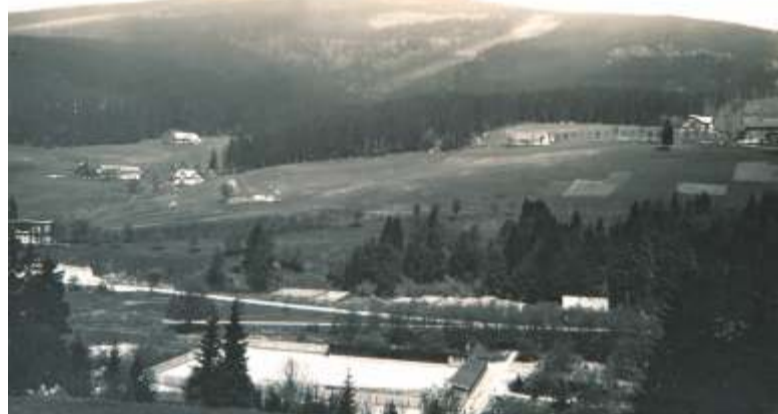
Plovárna na „Hammerboden“, pod Bedřichovem.

Přestože byl Špindlerův Mlýn historicky zimním střediskem, již před 100 lety tu začalo organizované koupání, když v létě roku 1923 začala veřejnosti sloužit první plovárna. Těšila se pozornosti a zájmu široké veřejnosti. Jako vhodné místo byla nejdříve zvolena oblast „Hammerboden“. Nacházela se mezi silnicí a řekou Labe - naproti Tabulovým boudám. Přibližně tam, kde s největší pravděpodobností pracovala Donthova sklárna, později malá železárna neboli hamr. V současné době je zde umístěna benzinová čerpací stanice. V dobrém úmyslu posloužit městu, ale i z důvodu snadné dostupnosti, sáhli obecní radní vedle. Už při první velké průtrži mračen 2. července 1926 nad Sedmidolím, velká voda poškodila koupaliště, ale i sousední hřiště. Historie se opakovala i v roce 1930, kdy po deštích stoupla voda v přehradní nádrži natolik, že „Hammerboden“ zaplavila.