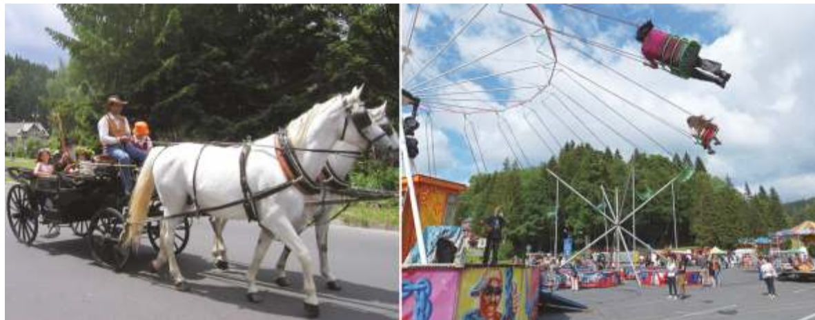
Ilustrační snímky ze Špindlerovských poutí.

Dle shrnutí Jitky Hronešové se členové komise KCR tématem Špindlerovské pouti zabývali na řadě jednání a na plánovaném přesunu místa konání intenzivně pracovali. Nemalé úsilí