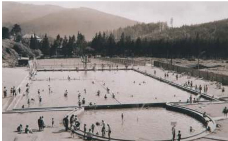
Plovárna v místech „Schöner Boden“ pod Medvědinem.

Historický snímek, archiv Špindlerovské noviny.