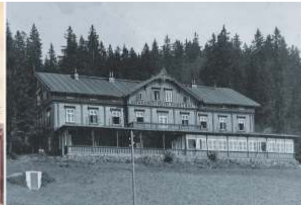
Archív ŠN. Hotel Krakonoš.