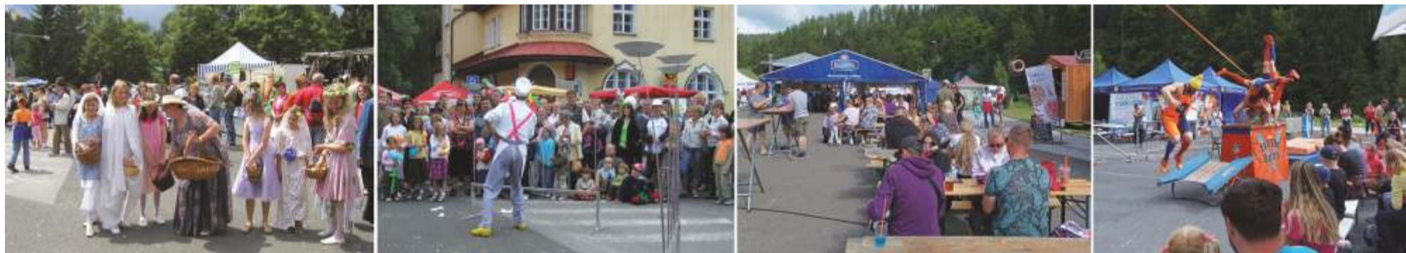
Ilustrační snímky ze Špindlerovských poutí.