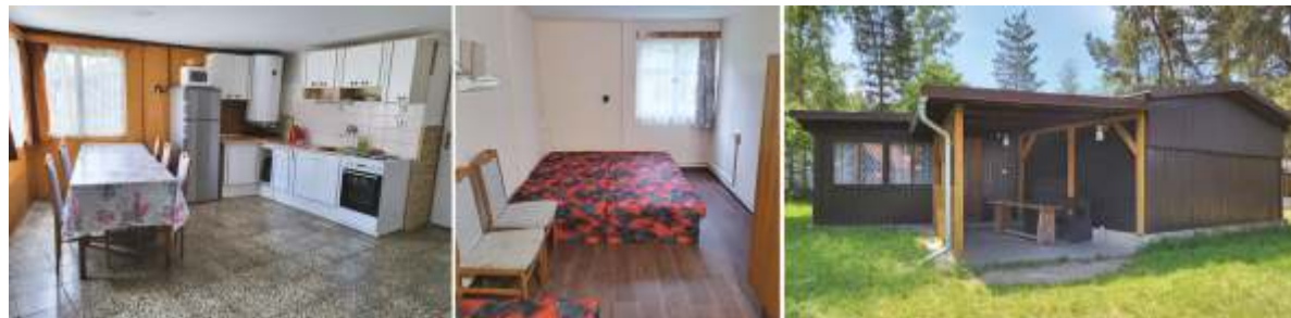
Rekreační objekt Staré Splavy - Máchovo jezero.