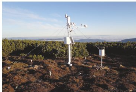
Při svých toulkách nedalekou krajinou možná dorazíte k „podivnému“ zařízení. Jedná se o meteostanici. Na snímcích ji nyní vidíte v létě a v zimě.

Nejsevernější a zároveň nejcitlivější část nejvyšších českých hor, krkonošská tundra, je pod významným vlivem klimatických změn. Zdejší monitoring vývoje počasí, jenž poskytuje klíčové informace pro jejich pochopení a odhad dalšího vývoje vegetace krkonošské tundry, pomáhají zaznamenávat automatické meteorologické stanice instalované na Studniční hoře, u bývalých Jestřábích bud, u Rýchorské boudy a nad bývalou Klínovou boudou. Letos po více než dvacetileté službě proběhla modernizace sítě stanic, jež umožní pokračování dlouhodobého sledování klimatu, jehož aktuální změny působí i na přírodu vzácného ekosystému arko-alpické tundry na hřebenech.