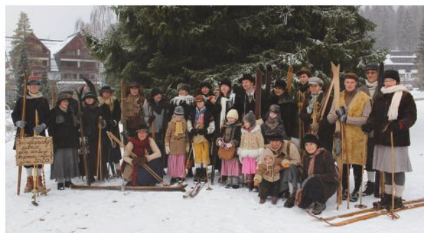
Při začátku zimní sezony 2020/21 se lyžníci z důvodů pandemie nesešli. A tak to snad vyjde letos.