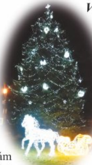
Vánoční strom slavnostně rozsvícený