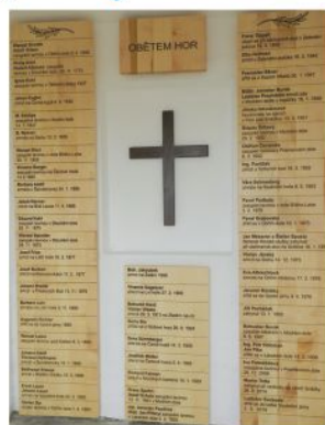
Interiér Památníku oběhem hor. Ilustrační foto: -dp-

Kaplička připomíná zapomenuté tragédie. Jména na dřevěných tabulkách uvnitř památníku patří obětem zapsaným v kronikách z posledních 300 let a ze záznamů horské služby starých půl století. -dp-