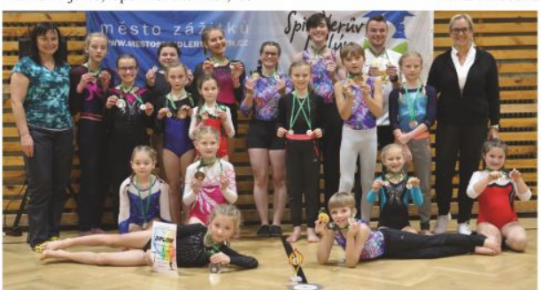
Ilustrační foto C. Vrabec ml.

Z podkladů H. Marka, Generali Česká pojišťovna, zpracovala -dp-