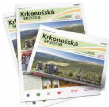
Titulní stránka letního vydání turistických novin Krkonošská sezona.

Písemné odpovědi se svou adresou zasílejte na: Regionální turistické informační centrum Krkonoše, Krkonošská 8, 543 01, Vrchlabí, ČR, nebo na e-mail: info@krkonoše.eu. Pokud se na vás usměje štěstí, získáte voucher na ubytování v hotelu Horal ve Sv. Petru ve Šp. Mlýně v mimosezoně, www.orearesorthoral.cz, nebo rodinnou vstupenku na Stezku korunami stromů Krkonoše, www.stezkakerkonoše.cz, voucher do wellness centra v Harmony Club Hotelu ve Šp. Mlýně, www.harmonyclub.cz, knihu Zmizelá Čechy - Vrchlabí, od Regionálního infocentra Krkonoše anebo knihu Poklady Krkonošského muzea I ze Správy KRMAP. Uzávěrka odpovědí je 31. října 2020, losování v prosinci 2020.