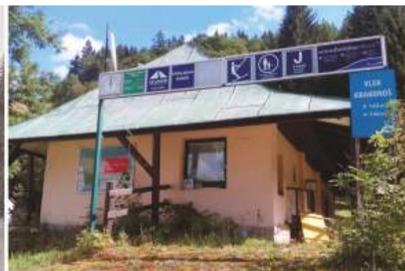
Spodní stanice vleku Krakonoš v původní podobě.