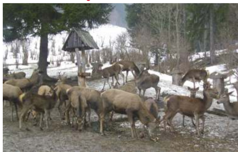
Ilustrační foto: -dp-

„Dobrý den, rád bych oznámil, že jsem zrovna pod Sněžkou a slyším tady řvát medvědy. Musejí být alespoň tři!“ Podobné e-maily či telefonáty na tishovou linku Správy KRNP v posledních dnech dostáváme opakovaně. Rádi bychom znepokojené návštěvníky uklidnili. Nejsou to medvědi, ale jeleni. V současné době probíhá jelení říje. Zaslýchout tedy troubení jelena není vůbec nic zvláštního. Je do jisté míry i pochopitelné, že neznalý člověk se charakteristickým zvukem jelení říje nechá snadno zmást.