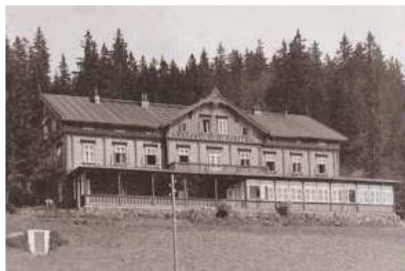
Fotografie někdejšího hotelu Krakonoš.