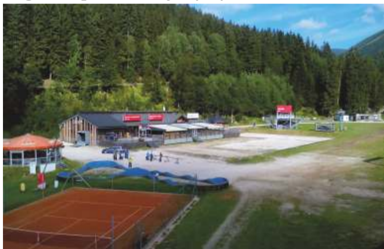
Fotografie ze Sv. Petra, kde bude na pár dní ledová plocha: -dp-

Na veřejných vývěskách se můžeme s dočist o připravované akci ve dnech 10. - 12. 12. 2020, kdy se na jednorázově vybudovaném kluzišti na dojezdu pod sjezdovkami ve Svatém Petru uskuteční dva zápasy pod širým nebem Winter Classic. Jeden extraligový mezi Spartou a Hradcem Králové, druhý prvoligový mezi kladenskými Rytíři, jichž je Jágr hrajícím majitelem, a nováčkem tuzemské druhé nejvyšší soutěže Vrchlabím.