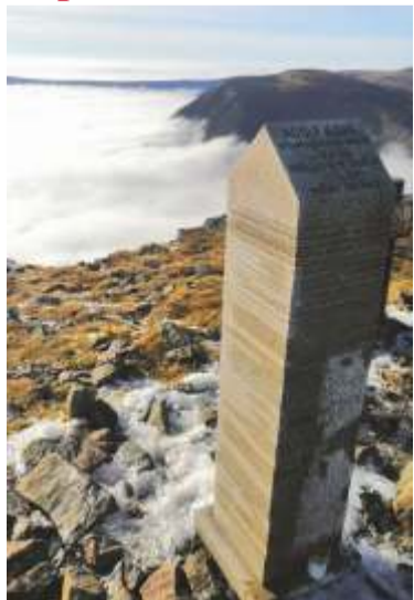
Pomník na Sněžce.