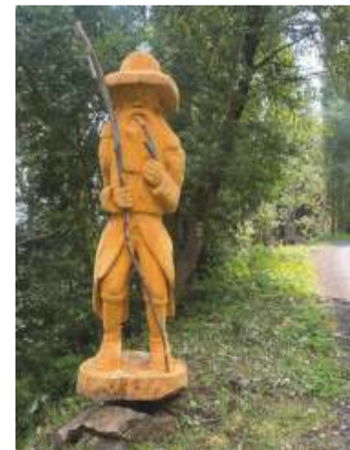
Ztvárnění Krkonoše z různých materiálů nalezneme v mnoha podobách na četných místech nejvyšších českých hor. Poměrně nově je „usazen“ a sympaticky zdobí místo u cesty z Krausových bud směrem na Rovinka a Benecsko.