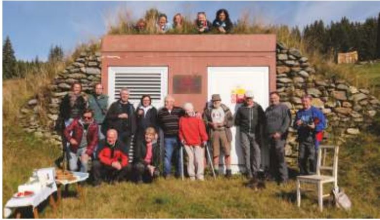
Snímek z malé říjnové slavnosti, provedené se souhlasem ČEZ.