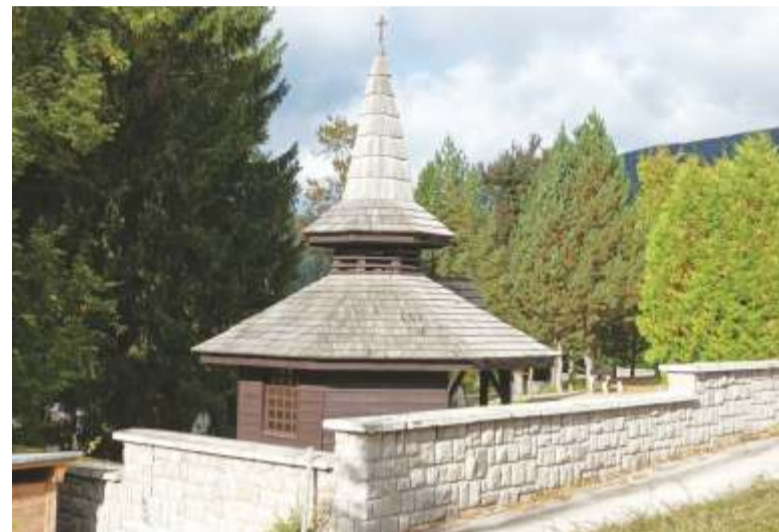
Pietní altán k uctění předků.