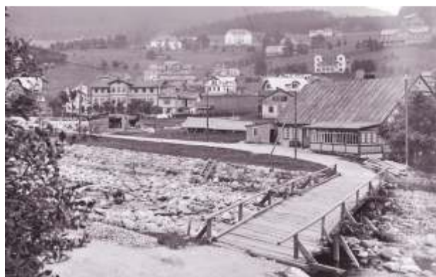
Archivní snímek dokumentuje pro většinu z nás neobvyklý pohled na centrum města.