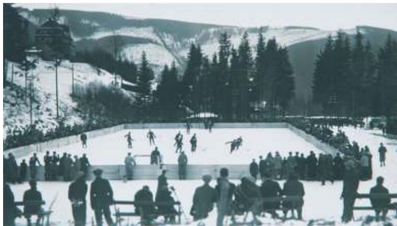
Plocha s antukovým povrchem pro letní sporty, v zimě kluziště s mantinely.