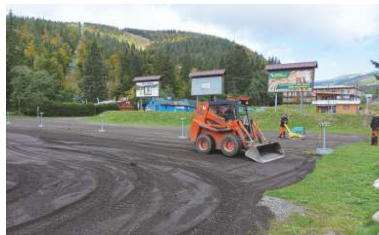
Služby města provádí terénní úpravy parkovací plochy pod Medvědíkem.