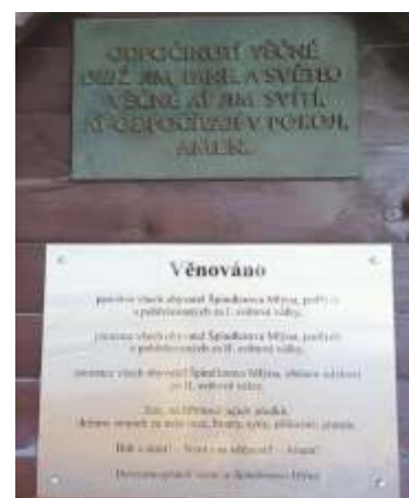
Pietní desky věnované památce všech padlých a pohřešovaných obyvatel Špindlerova Mlýna při 1. a 2. světové válce a obětem všech událostí po 2. světové válce.