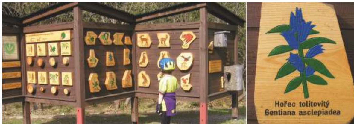
Panely s populárně naučnými informacemi a barevně malovanými obrázky (např. na trase Špindlerův Mlýn - Divčí lávky, Bílé Lábe - hřiště u Svozu) zajímají děti i dospělé.