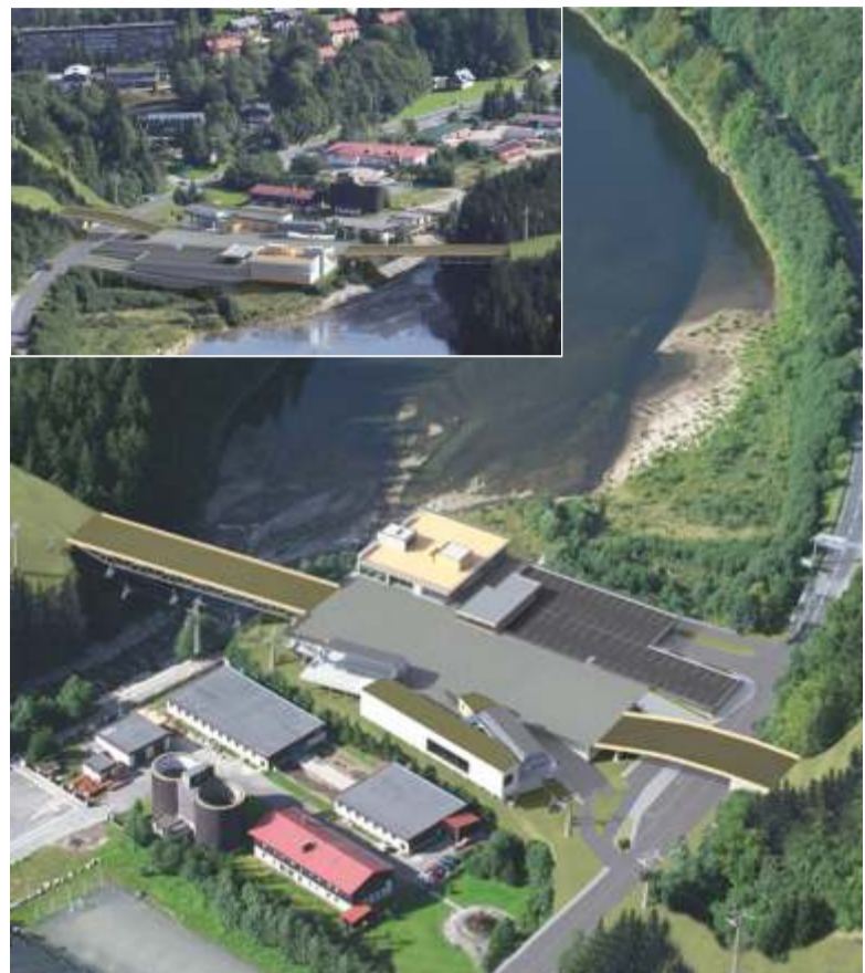
Studie zobrazuje plánovaný Terminál P1.