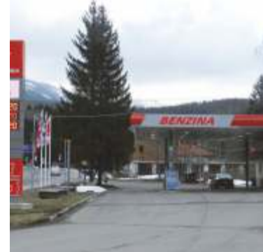
I ve Špindlerově Mlýně bude z Benziny Orlen.