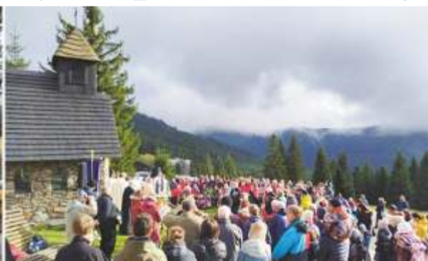
Foto mše u sv. Františka z Assisi