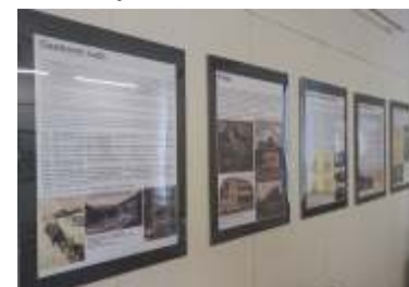
Ilustrační snímky nástěnných panelů zavěšených ve špindlerovské městské knihovně.