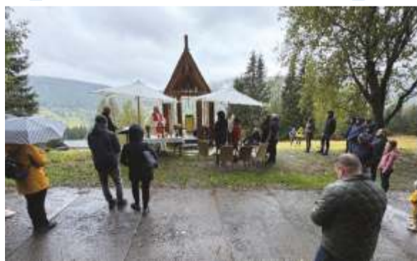
Foto mše u sv. Barbory