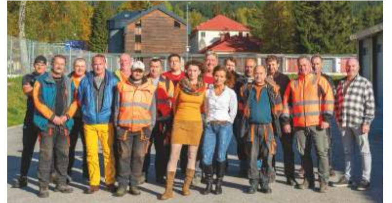
Aktuální tým Služeb města Špindlerův Mlýn s. r. o. (bez osmi lidí).

Později se ukázalo, že hlavně pro malé obce byly „příspěvkovky“ vhodnější a další úprava umožnila fungování obojího. V tu dobu již Město Špindlerův Mlýn změnu dokončilo a Služ-