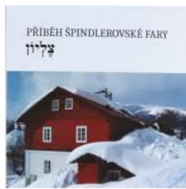
Titulní strana knihy.

A dále se věnovala obsahu: „Fara a kostel patří k historii Špindlerova Mlýna. Ke kostelu patří duchovní správcí a faráři, kterým je věnována jedna kapitola. Následně jsem rozdělila historii Špindlerova Mlýna do tří období. Do doby, kdy sem přicházeli první osadníci z Alp od 14. století do roku 1945, další od roku 1945 do 90. let minulého století. Obsah vrcholí obdobím od 90. let min. století do současnosti, a vždy mají slovo především lidé. O životě v malé faře bylo už napsáno