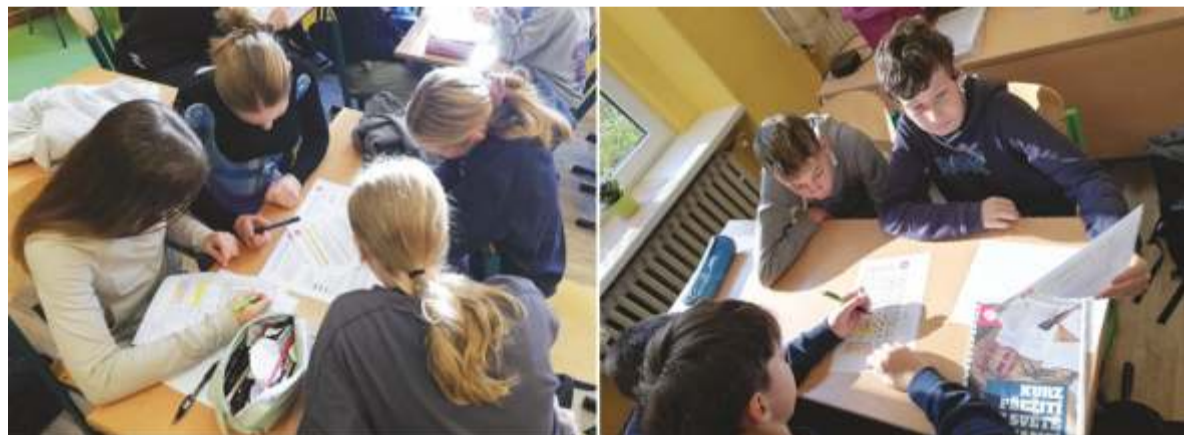
Ilustrační foto, archiv ZŠ Šp. Mlýn.

Ve čtvrtek 17. října 2024 to na naší škole vypadalo trochu jinak než obvykle. Některé třídy totiž odložily učebnice a ponořily se do světa peněz, rozpočtů a finančního plánování.