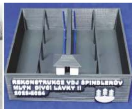
Společný snímek důležitých aktérů a ilustraci 3D modelu přinášíme aktuálně, podrobnosti v dalším vydání Špindlerovských novin.