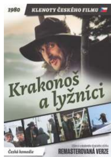
Upoutávka na film Krakonoš a lyžníci.