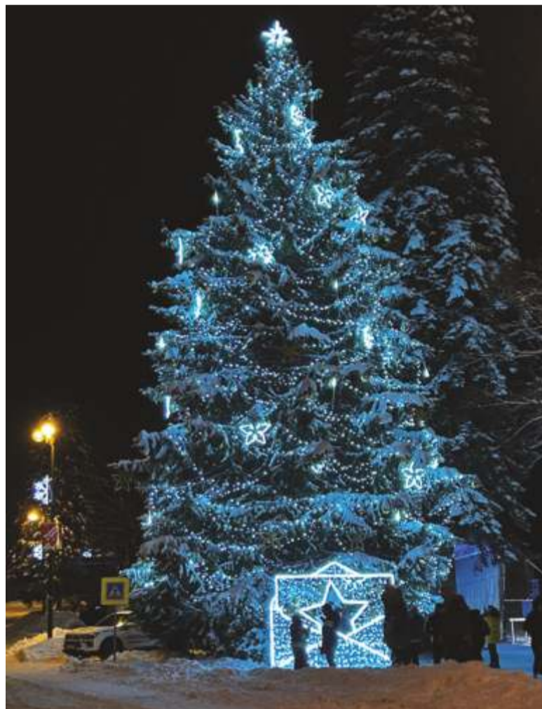
Hezký Advent a krásné Vánoce.