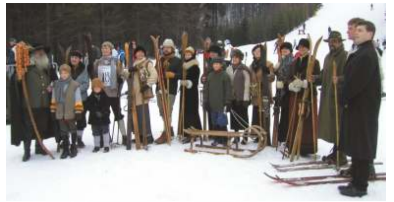
První ročník setkání v prosinci roku 2004.