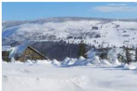
Ilustrační snímek: -dp-

Byly zimy, kdy sníh ve vysoké vrstvě zasypal krajinu a tím změnil celý její reliéf. Také se na to pamatujete... „A tak jestlipak víte, co je „naše největší pamětihodnost“? ...ve svém repertoáru někdejšího hudebně - tanečního vystoupení přednášely členky Folklorního souboru Špindleráček. Začtete se do „kérkonoštiny“ Jaromíra Horáčka ze sbírky: „Nic kalýho zpod Žalýho“.