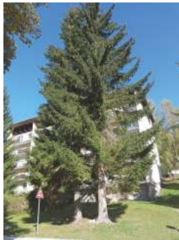
Četné nostalgické vzpomínky provázely kácení smrků ztepilých dne 13. 11. 2024.