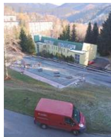
Snímky z probíhající a dokončovací práce.