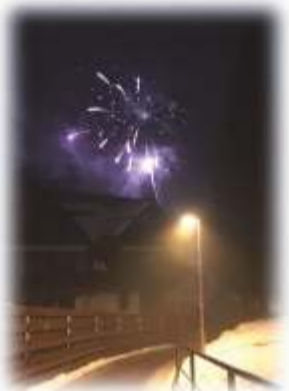
„Zatíší“ se špindlerovským ohňostrojem.

Vláda ČR schválila novelu zákona v oblasti pyrotechniky. Míří k projednání do Senátu. Zakazuje její prodej mimo kamenné prodejny s výjimkou nejméně nebezpečné kategorie F1. Upravuje prodej pyrotechnických výrobků na dálku, posiluje pravomoc obcí na svém území a stanovuje minimální vzdálenosti od určitých objektů, které při odpalování pyrotechnických výrobků musí být dodrženy. Obce budou moci vydat obecně závaznou vyhlášku, kterou na celém svém