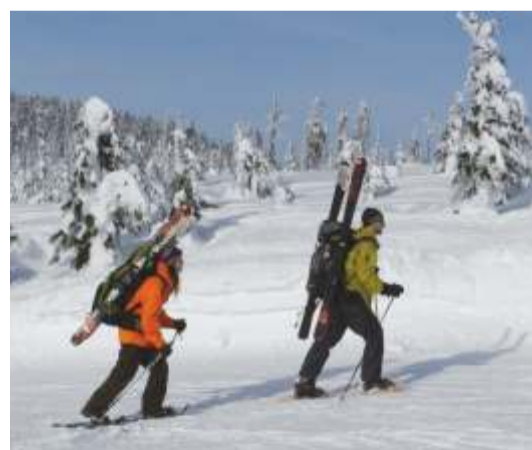
Ilustrační snímek z vrcholu Medvědína.

Zimní sporty nemusí vždy nutně souviset s lyžováním. Na mnohých místech (kromě přírodních chráněných partií, lavinových svahů, upravených lyžařských stop apod.) je možné vyrazit na pevných zimních botách nebo na sněžnicích na túru na sněhu. Tzv. snow walking je alternativou zdravého zimního sportování. Pod pojmem snow walking lze rozumět dvěma formami pohybu. Jednou z nich je Winter Nordic Walking na zimních turistických cestách s technikou chůze s hůlkami. Druhou jsou túry na sněžnicích ve sněhem třpytící se krajině. Žádný z pohybů nevyžaduje znalost lyžování. K účinku procházek na sněhu s hůlkami pracuje přibližně 90 % svalů. Přispívají k jemnému posílení jejich růstu, tvarují postavu, méně zatěžují klouby a jsou efektivnější než chůze bez hůlek. Pohyby trénují aerobní vytrvalost, posilují svaly zad a horní části těla. Jsou vhodné pro osoby mající potíže s koleny a zády, protože odlehčují pohybový aparát.