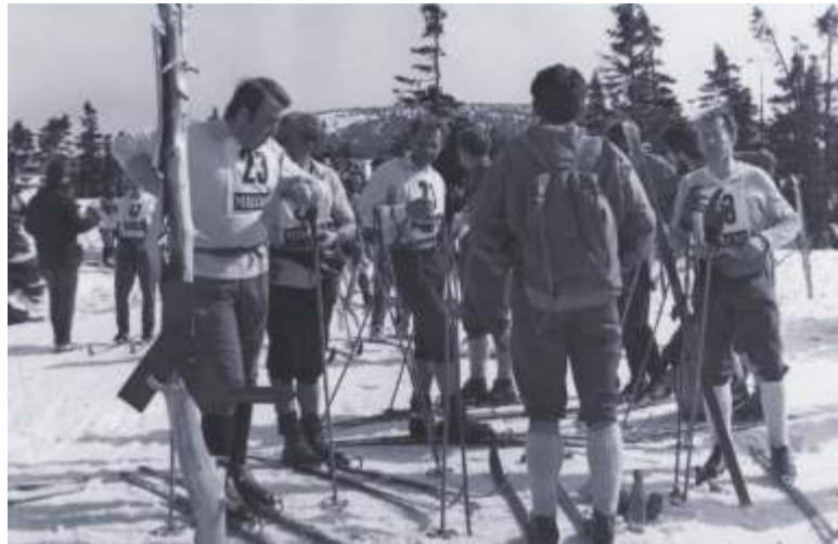
Běžecská hřídku Krkonošské 70 u Špindlerovy boudy, rok 1979.