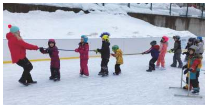
Medvidci na ledě