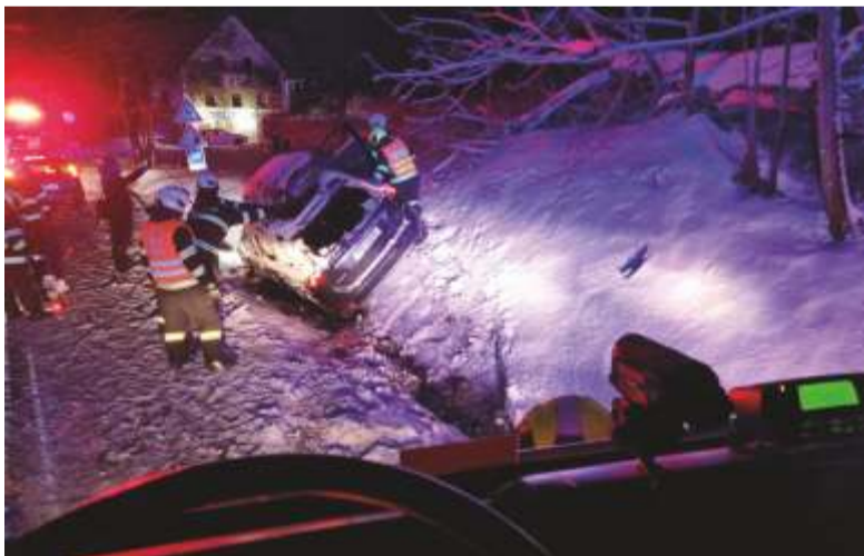
Fotografie ze zásahů vypadají opravdu děsivě. Naštěstí jsou, ve většině případech, kromě vyděšených posádek, pošramoceny jen plechy.