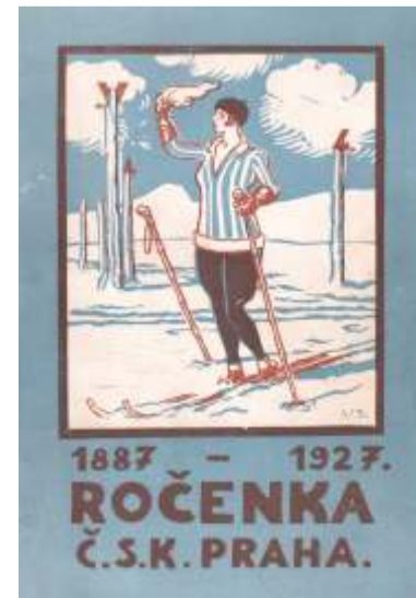
Titulka Ročenky 1887-1927.