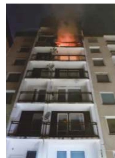
Fotografie pořízena v čase 03.52, kdy byl požár ve třetí fázi, tzn. v plném rozsahu. Na místě je apel hasičů na prevenci: Dávejte pozor na zapálené svíčky, cigarety, plynové hořáky, elektrické spotřebiče apod. Nejen před spaním, ale i při odchodu z domu vše zkontrolujte. Pomocníkem kuchyňského majetku je požární hlásič, který se dá pořídit za pár korun.

Všem hasičům děkujeme! Z podkladů Hasičů města Šp. Mlýn (JPO II) zprac. -dp-