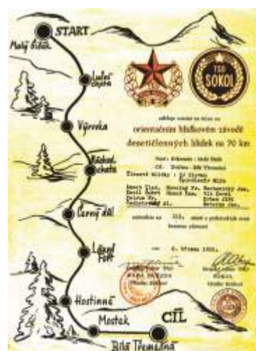
V roce 1955 při závodě Krkonošské 70 se desetičlenná „hřídku“ TJ Slovan umístila na 3. místě.

Vichr se proháněl po horách, na všech stezkách zavíval stopy v mokřem sněhu a chumelenice lomcovala větvmi zalesněných svahů. „Zaznívala píseň“, kterou „Krkonoše zpívají“ na cestu