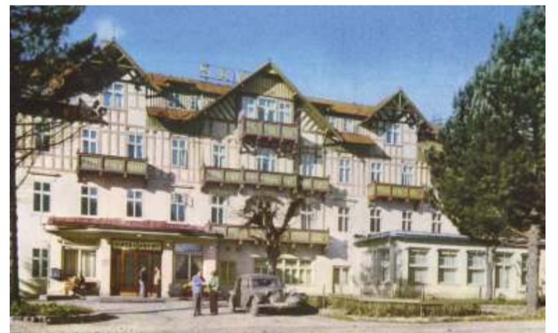
Snímek hotelu Savoy z roku 1962 (tzn. pořízený před 60 lety) zobrazuje místo setkávání mj. někdejší smetánky.