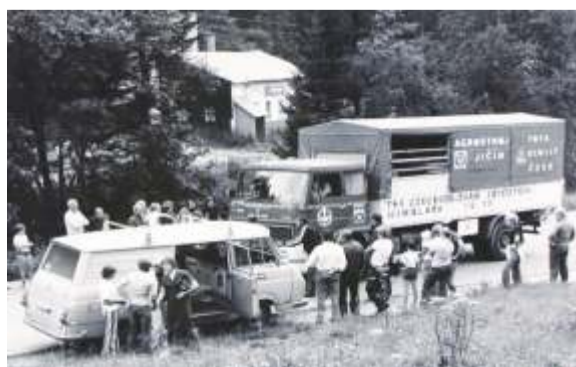
Rok 1979 nákladní vozidlo skupiny horolezeckého oddílu TJ Slovan Šp. Mlýn pro cestu do Himálaje s cílem zdolání vrcholu hory Manaslu North II.