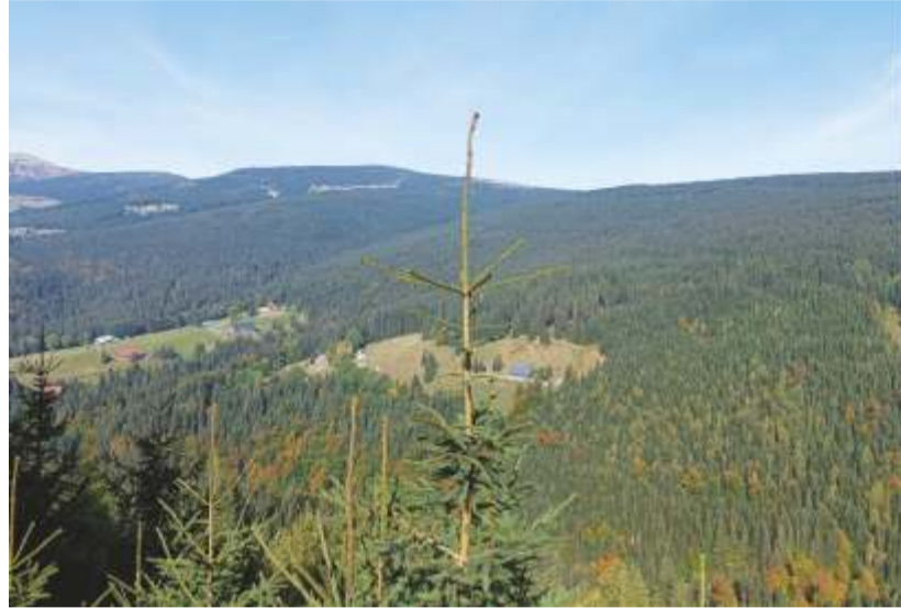
Špindlerův Mlýn má ve svém okolí krásné lesy.