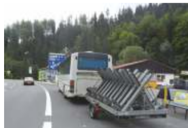
Cyklobus se zastávkou ve Šp. Mlýně.

Ze Špindlerova Mlýna (Sv. Petra) na Pláň se vyvezete lanovkou. Od horní stanice se vydáte vpravo po cyklotrase K17A, po chvíli odbočíte vlevo na cyklotrasu K17. Pokud byste po chvíli opět odbočili vlevo, můžete si po cyklotrase K17A zajet k Boudě na Pláni. Jinak pokračujte k rozcestí U Krásné Pláně, směrem Strážné. Na rozcestí se napojíte na cyklotrasu K1A, po které přes Šestidomí sjedete do Strážného. Odtud můžete pokračovat ve sjezdu do Vrchlabí nebo Dolního Dvora. Trasa má dvě alternativy. Od horní stanice lanovky po cyklotrase K17 vpravo. I tak dojedete k rozcestí U Krásné Pláně, odkud sjedete do Strážného. Trasa měří cca 6,5 km. Povrch je zpevněný.