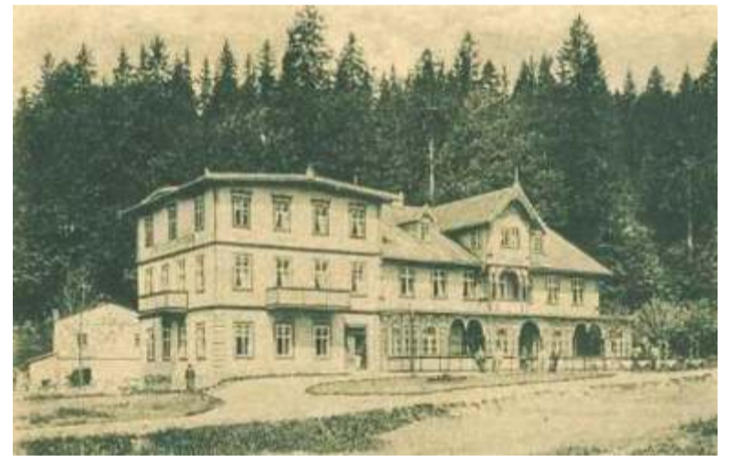
Historický hotel Krone v předminulém století.

V roce 1922 dorazil do Špindlerova Mlýna drobný štíhlý nemocný muž čtyřicátník, s hlubokými očima, spisovatel Franz Kafka (1883 - 1924). Na tři týdny se v hotelu Krone ubytoval. Chodil na procházky, ale chabě zdraví mu příliš dalekých pochodů a pohybu na horách nedovolilo. V hotelovém pokoji ale pilně psal. Ta hromádka popsaných listů obsahovala úvod k jednomu z nejslavnějších děl 20. století.