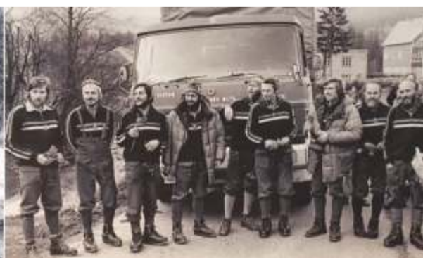
Snímek horolezců po návratu z expedice