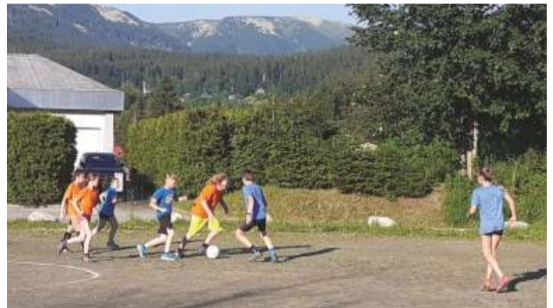
Ze zápasu FC Za barákem (oranžoví) - Chábří (modří).