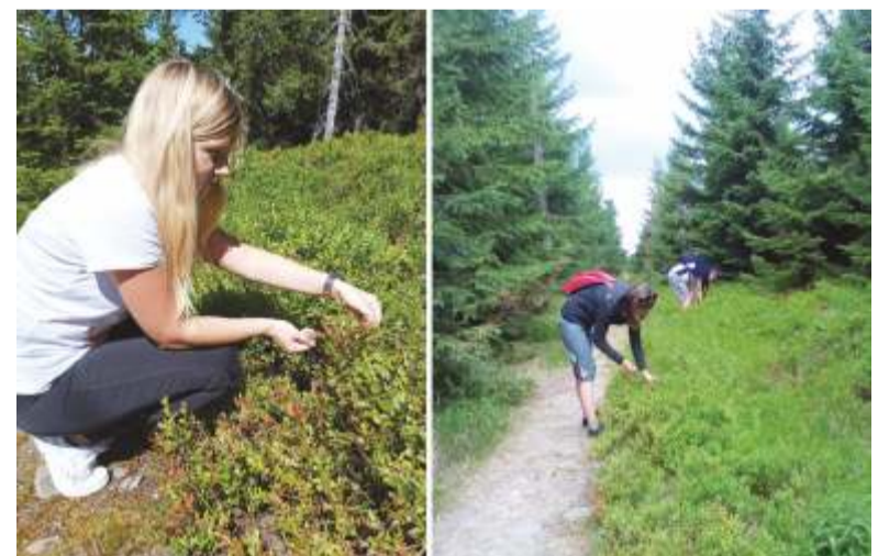
Málokterý kolemjdoucí turista při pohledu na borůvčí plné plodů odolá. Vždyť borůvky jsou tak chutné a zdravé.

Správa KRMAP, resp. odborníci na krkonošské louky, v posledních letech na řadě enkláv řeší dilema: budeme mít v Krkonoších květnaté horské louky nebo budeme sbírat luční borůvky? Borůvce, opadavému keřku patřícímu do jehličnatých a listnatých lesů, na vřesoviště a rašeliniště v Krkonoších, vyhovují půdy nevysychavé, kyselá a chudá na živiny. Borůvčí na loukách je však důkazem postupné přeměny louky v původní les. Proto louky, mající naději na záchranu, od porostů borůvky postupně osvobozují a borůvčí na některých lokalitách vyřezávají.