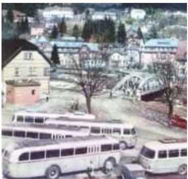
Autobusy parkující přímo v centru Špindlerova Mlýna, připravené k nástupu rekreačních na celodenní výlety do okolí. Možná do některého z nich v příběhu zmínovaný pes tulák naskočil.

Příběh se odehrál ve Špindlerově Mlýně v době rekreace Revolučního odborového hnutí (ROH). Toho času