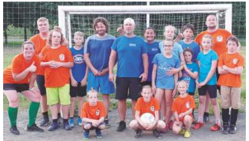
Společné pozápasové foto.

Během června odstartovala ve Špindlerově Mlýně fotbalová liga. Jedná se o projekt, do kterého jsou zapojeny nejen děti z místního fotbalového kroužku, ale i ty, které do kroužku nechodí. Dále jsou do projektu zapojeni i někteří rodiče. Tým je tak poskládaný jak z dětí, tak i z dospělých. Ligy se účastní celkem tři týmy. Každý si zvolil svůj název: Chábří, FC Panebožecotodělám a FC Za barákem. Hraje se na hřišti u Normy. Každý zápas se hraje na 2x15 minut.