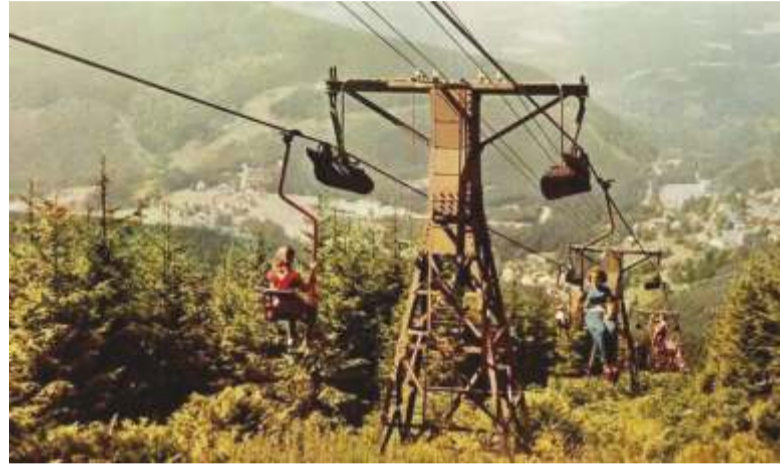
Jednosedačková lanovka ve Sv. Petru.

dvědi boudy s cílem v ohybu silnice na Špindlerovku. Tyto plány stejně jako záměr uspořádat mistrovství Německa v alpských disciplínách v roce 1943 zhatil průběh 2. světové války. V roce 1946 do Špindlerova Mlýna přišel se svou manželkou tehdy již známý všestranný lyžařský závodník Jaroslav Lukeš, šestinásobný mistr republiky v klasických i sjezdových disciplínách a účastník zimní olympiády 1936. Důvodem Lukešova příchodu bylo převzetí lyžařských můstků pro Svaz lyžařů. On však ve městě zůstal ještě řadu let. K dalšímu poválečnému rozvoji lyžování ve Špindlerově Mlýně přispěl hlavně tím, že prosadil vykácení lesa pro černou sjezdovku ve Svatém Petru