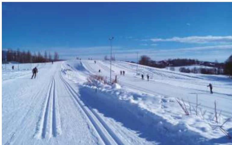
Běžecký areál u fotbalového hřiště Vejsplachy ve Vrchlabí.