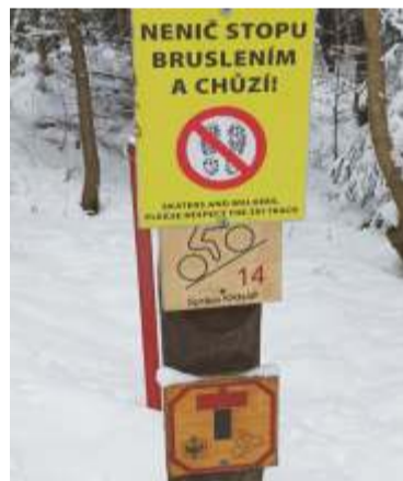
Lyžařská běžecká stopa Bud' fit míří do nitra Labského dolu.

Upravovány jsou mnohé cesty a svážnice například vedoucí ze Skiareálu Sv. Petr směrem ke Hromovce, dále na Krásnou Pláň, anebo cesty kroužící kolem Medvědína. Sázkou na jistotu pěkného sportovního výkonu je lyžařský běžecký stadion na Horních Mísečkách, kam se dopravíte „Vodovodní“ modrou turistickou sjezdovkou. Zkušeným matadorům nemusíme vysvětlovat. Vám, kteří neznáte, doporučujeme konzultaci v Turistickém informačním centru při MěÚ ve Šp. Mlýně, kde vám poradí a nadělí mapku se zakreslenými trasami.