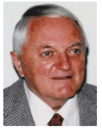
Portrét M. Jedličky, zdroj internet.

O 14 let později se univerziáda do Špindlerova Mlýna vrátila, a to nejen do Svatého Petru, ale též na Horní Mí-