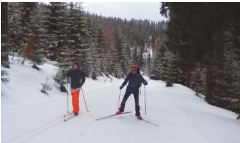
Ke klasickému běžeckému lyžování i bruslení (anglicky skate) jsou vhodné například upravované cesty - svážnice v okolí Šp. Mlýna.

Osmikilometrová městská trasa určená pro klasický běh na lyžích, začíná u soutoku Labe a Bílého Labe u Dívčích lávek (nedaleko restaurace Myslivna). Je pravidelně upravována a běžkařům nabídne opravdu pěkný sportovní prožitek v těsném sepětí s krkonošskou přírodou za zvuku svěží tekoucí labské vody. První kilometr mírného stoupání, druhý a třetí kilometr pro dobrou pohodu a občasný skluz, a poslední čtvrtý kilometr před obrátkou zpět prověří vaši fyziku. Klesající cestou zpět příjemné svezení. V těsné blízkosti řeky jen pozor na občasně namrzlé úseky. Bělostný sníh, azurová obloha a mezi stromy prosvítající slunce, to musíte zažít. Jen prosíme, nevstupujte do upravených lyžařských stop a buďte vzájemně ohleduplní.