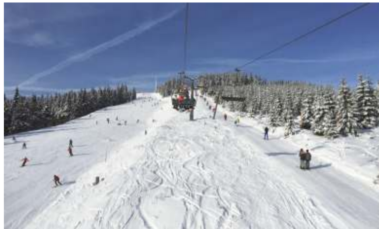
Lyžování na Medvědině.