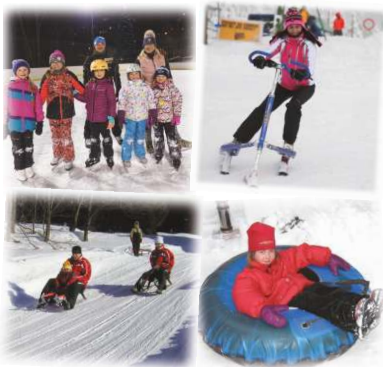
Bohatá nabídka sportovních radovánek ve Šp. Mlýně.