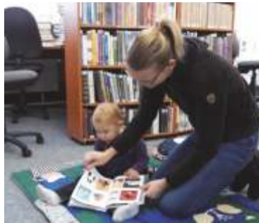
Interiér knihovny je i pro nejmenší dětičky příjemný.

Marie Čeřovská, Městská knihovna Šp. Mlýn