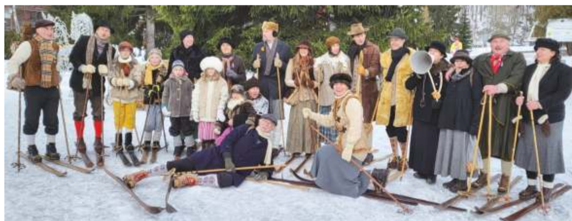
Špindlerovští lyžníci svým setkáním 27. prosince 2021 zahájili zimní sezonu.