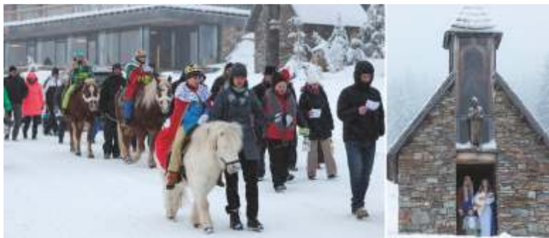
Horská slavnost Tříkrálová na bílém sněhu vysoko na horách.

Resort Sv. František - Erlebachova a Josefova bouda, Špindlerův Mlýn