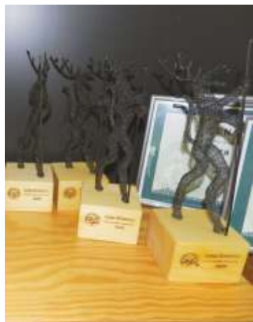
Čestná Cena je symbolizována soškou představující nejstarší známou podobu ducha hor Krakonoše/Rübezahla podle mapy Martina Helwiga.